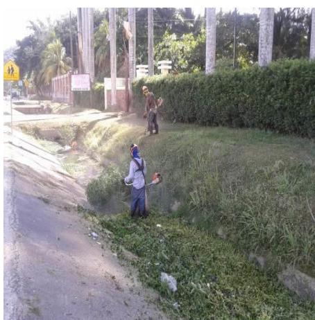
Limpieza del derecho de vía

Derrumbes: existen dos derrumbes que el concesionario está pendiente de remover, uno en el km 13+000 lado izquierdo que tiene aproximadamente 60 m3 de material que limpiar, el otro está ubicado en el km 24+000 lado izquierdo, este tiene aproximadamente 500 m3, este tiene obstruido el paso por el hombro y es de mucho riesgo ya que hay material suelto que en cualquier momento puede caer a la vía.