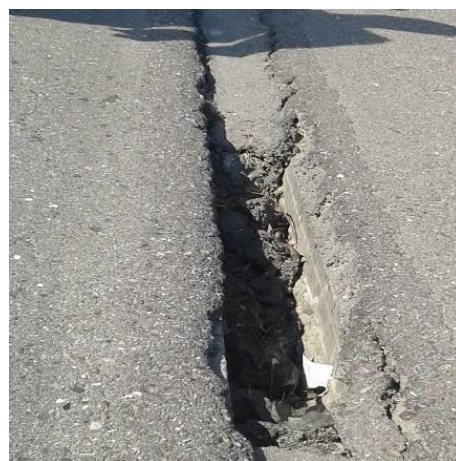
Grieta en superficie de rodadura Tramo San Pedro Sula - Cortés