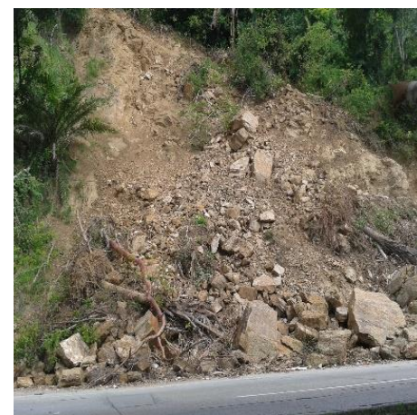
Derrumbe sin remover en Km 24 tramo SPS – Puerto Cortés