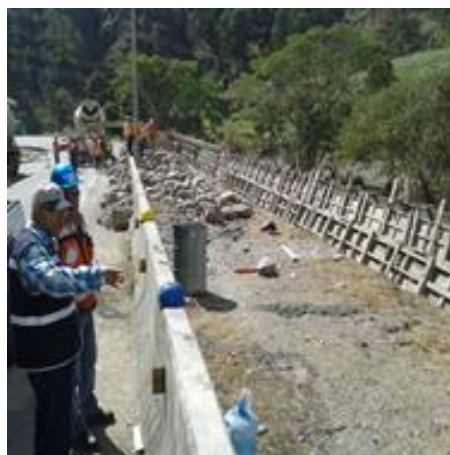
Construcción de muros de contención en obras de ampliación