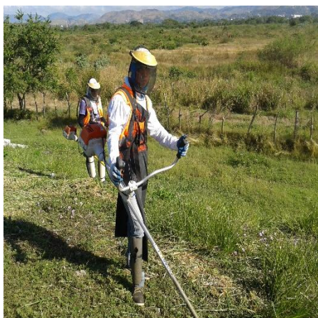
Trabajos de Mantenimiento Rutinario y Preventivo