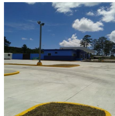
Estación de Peaje de Siguatepeque Terminada.