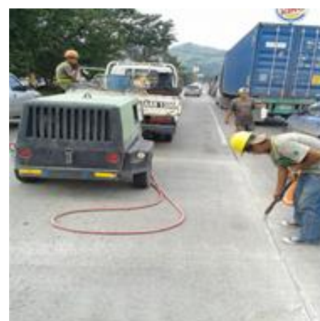
Bacheo en losas de concreto tramo SPS – Puerto Cortés