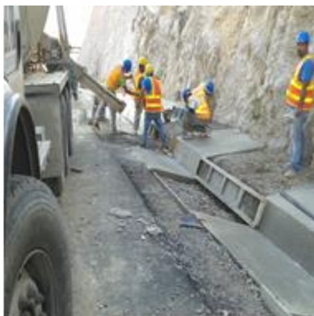
Construcción de cunetas en obras de ampliación

En la Zona del derrumbe ocurrido el 16 de octubre entre las estaciones 98+480 y 98+620, las actividades de remoción del derrumbe continúan paradas.