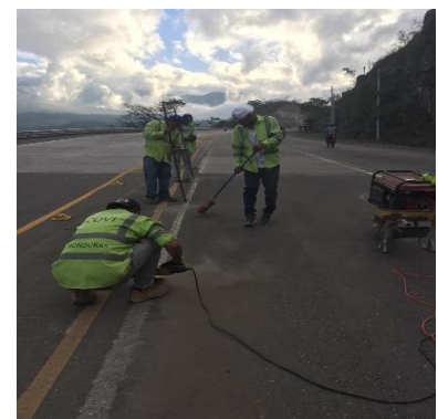
Trabajos de Mantenimiento Rutinario